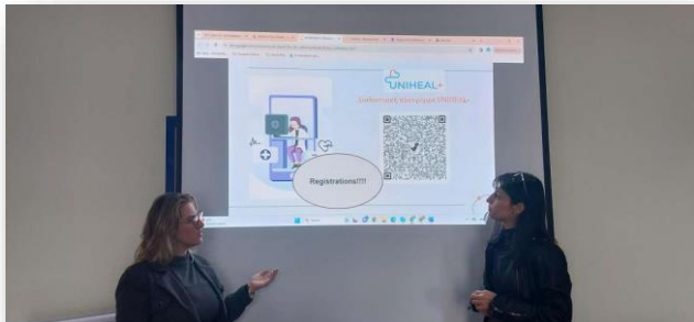
Εικόνα 6: Πιλοτική συνεδρία από την XENIOS POLIS (Ελλάδα)

κάλυψε περίπου 1,5 ώρα. Η πιλοτική παρουσίαση περιελάμβανε τα ακόλουθα θέματα: 1. Γενική σύντομη εισαγωγή σχετικά με το έργο UNIHEAL+ (στόχοι, αποτελέσματα του έργου, αποτελέσματα πυλώνων από την έρευνα) 2. Ιστορικό και εμπειρία των συμμετεχόντων σχετικά με την ψηφιακή υγεία και προσδοκίες από την πλατφόρμα ηλεκτρονικής μάθησης 3. Παρουσίαση της πλατφόρμας, εγγραφές, αξιολόγηση και συζήτηση