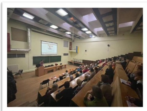
Εικόνα 5: Πολλαπλασιαστική εκδήλωση από το Xwhy (Λιθουανία)

Η πολλαπλασιαστική εκδήλωση στη Λιθουανία διοργανώθηκε πρόσωπο με πρόσωπο στις 12 Δεκεμβρίου 2023 στο Πανεπιστήμιο της Τρίτης Ηλικίας Medardas Čobotas στο Βίλνιους. Την παρακολούθησαν 29 συμμετέχοντες, οι οποίοι ήταν εκπαιδευτικοί που εργάζονται στους τομείς της υγειονομικής περίθαλψης και της εκπαίδευσης ενηλίκων, καθώς και οι μαθητές τους που παρακολουθούσαν τάξεις και μαθήματα. Οι περισσότεροι από τους σπουδαστές (ενήλικες εκπαιδευόμενοι) προέρχονταν από τη Σχολή Υγιεινού Τρόπου Ζωής (καθώς και τη Σχολή Ψυχολογίας) του Πανεπιστημίου Medardas Čobotas της Τρίτης Ηλικίας, αλλά και από άλλους οργανισμούς όπως το The Critical, γραφείο έρευνας και σχεδιασμού, και το Vilnius College of Design.