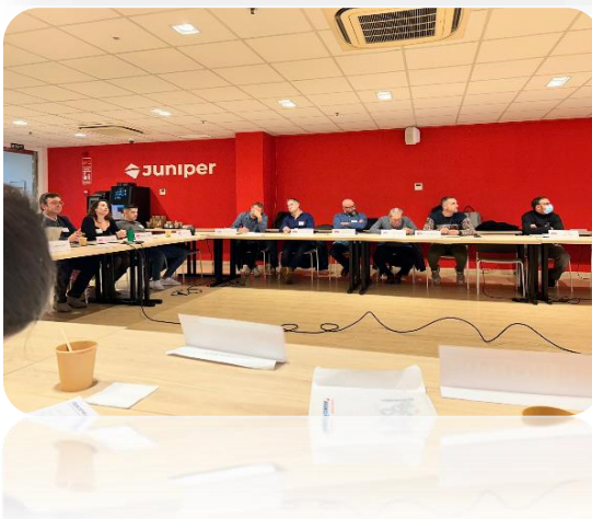
Εικόνα 1: Πιλοτική συνεδρία από το ITC (Ισπανία)