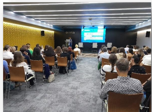
Εικόνα 3: Πολλαπλασιαστική Εκδήλωση από την FAY (Ισπανία)

Επιπλέον, το Fundación Ayesa υλοποίησε την πολλαπλασιαστική του εκδήλωση στις 27 Οκτωβρίου 2023 στα γραφεία του Ayesa και δέχθηκε συνολικά 62 συμμετέχοντες που σχετίζονται με τον τομέα της υγείας, εκ των οποίων (36) ανήκουν σε πρόγραμμα επαγγελματικής κατάρτισης που σχετίζεται με την υγεία και (26) ήταν επαγγελματίες υγείας από κοινωνικές οργανώσεις.