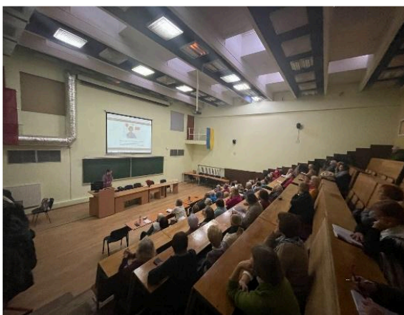
5 paveikslėlis: Xwhy (Lietuva) viešinio renginys

Viešinio renginys Lietuvoje surengtas 2023 m. gruodžio 12 d. Medardo Čoboto Trečiojo amžiaus universitete Vilniuje. Jame dalyvavo 29 dalyviai - sveikatos priežiūros ir suaugusiųjų švietimo srityse dirbantys pedagogai, taip pat jų studentai, lankantys užsiėmimus. Dauguma studentų, t.y. suaugusiųjų besimokančiųjų, atvyko iš Medardo Čoboto trečiojo amžiaus universiteto Sveikos gyvensenos fakulteto (taip pat Psichologijos fakulteto), taip pat iš kitų organizacijų, pavyzdžiui, tyrimų ir dizaino agentūros "The Critical" ir Vilniaus dizaino kolegijos.