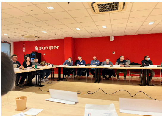
2 pav.: ITC (Ispanija) viešinimo renginys

2023 m. spalio 31 d. ITC įgyvendino bandomąjį projektą ADEMA universitetinėje mokykloje Ispanijoje, kuriame dalyvavo 26 dalyviai. Be to, 2024 m. sausio 12 d. ITC įgyvendino dauginamąjį renginį, kuriame dalyvavo 20 dalyvių, BNI išplėstinių tinklų renginyje, kuriame 20 specialistų išreiškė susidomėjimą UNIHEAL+ mokymo platforma ir programėle, o svarbiausia - jos tvarumo potencialu.