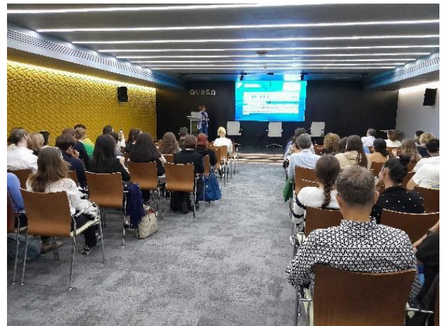
3 pav.: FAY (Ispanija) viešinimo renginys

Bandomoji sesija, kurią surengė Fundación Ayesa , vyko 2023 m. spalio 27 d. Fundación Ayesos biure (Sevilijoje), jos trukmė - 2 valandos. Joje dalyvavo 62 dalyviai, iš kurių 26 buvo sveikatos priežiūros specialistai iš socialinių organizacijų ir 36 studentai, kurie mokosi su sveikata susijusioje profesinio rengimo mokymo programoje aukštojoje mokykloje "IES Sotero Hernández".