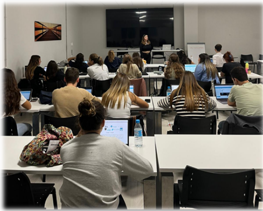
1 pav.: ITC (Ispanija) pilotinė sesija

2023 m. spalio 31 d. ITC įgyvendino bandomąjį projektą ADEMA universitetinėje mokykloje Ispanijoje, kuriame dalyvavo 26 dalyviai. Be to, 2024 m. sausio 12 d. ITC įgyvendino dauginamąjį renginį, kuriame dalyvavo 20 dalyvių, BNI išplėstinių tinklų renginyje, kuriame 20 specialistų išreiškė susidomėjimą UNIHEAL+ mokymo platforma ir programėle, o svarbiausia - jos tvarumo potencialu.