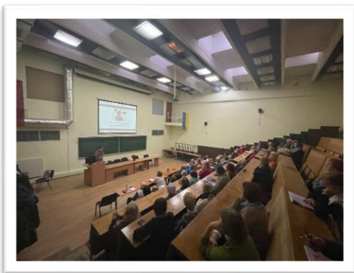
Imagine 5: Evenimentul Multiplicator de la Xwhy (Lituania)

Evenimentul multiplicator din Lituania a fost organizat față în față pe 12 decembrie 2023 la Universitatea Medardas Čobotas a Vârstei a treia din Vilnius. La acesta au participat 29 de participanți care erau educatori care lucrează în domeniul sănătății și al educației adulților, precum și studenți ai acestora care frecventează cursuri și cursuri. Majoritatea studenților (cursanți adulți) proveneau de la Facultatea de stil de viață sănătos (precum și de la Facultatea de Psihologie) din cadrul Medardas Čobotas University of the Third Age, precum și de la alte organizații precum The Critical, agenție de cercetare și design, și Vilnius College of Design.