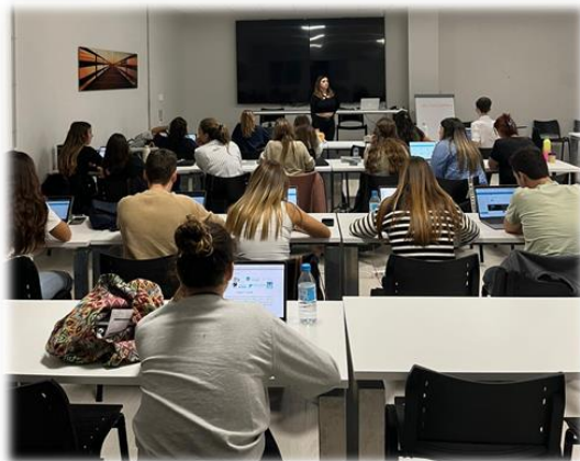
Imagine 1: Sesiune de pilotare de la ITC (Spania)

ITC a implementat pilotarea pe 31 octombrie 2023 la Școala Universitară ADEMA, în Spania, cu 26 de participanți. În plus, ITC a implementat evenimentul de multiplicare pe 12 ianuarie 2024, cu 20 de participanți, în cadrul evenimentului de networking BNI expand, unde 20 de profesioniști și-au exprimat interesul pentru platforma de formare și aplicația UNIHEAL+ și, ceea ce este cel mai important, pentru potențialul său de sustenabilitate.