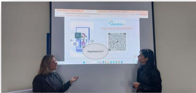
Imaginea 6: Sesiune de pilotare de la XENIOS POLIS (Grecia)

XENIOS POLIS a organizat o sesiune de pilotare față în față în Atena/Grecia, pe 21 decembrie 2023, în cadrul căreia 21 de participanți au făcut cunoștință cu ideea și obiectivele proiectului, au făcut schimb de idei și au împărtășit sugestii privind sănătatea digitală. Pilotarea s-a adresat studenților cu vârste cuprinse între 17-19 ani care se înscriu la cursuri și cursuri de formare atât la competențe digitale, cât și la cursuri de masterat pe specializarea sănătate digitală. Prezentarea proiectului UNHEAL+ și a cursurilor incluse a durat