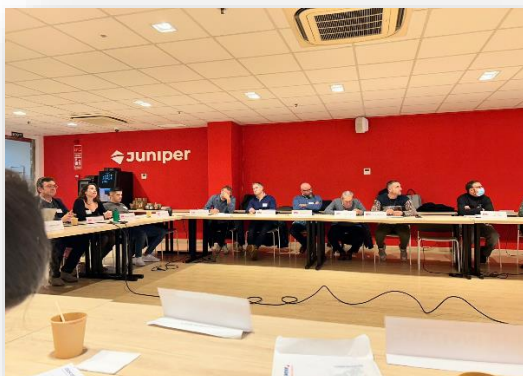
Imagine 2: Eveniment multiplicator de la ITC (Spania)

Sesiunea de pilotare organizată de Fundación Ayesa a avut loc pe 27 octombrie 2023 în birourile Ayesa (Sevilla), cu o durată estimată de 2 ore. A fost implementată față în față și a primit un total de (62) participanți din care, (26) sunt profesioniști din domeniul sănătății din organizații sociale și (36) sunt studenți înscriși într-un program de formare profesională în domeniul sănătății în cadrul Școlii de învățământ superior "IES Sotero Hernández".